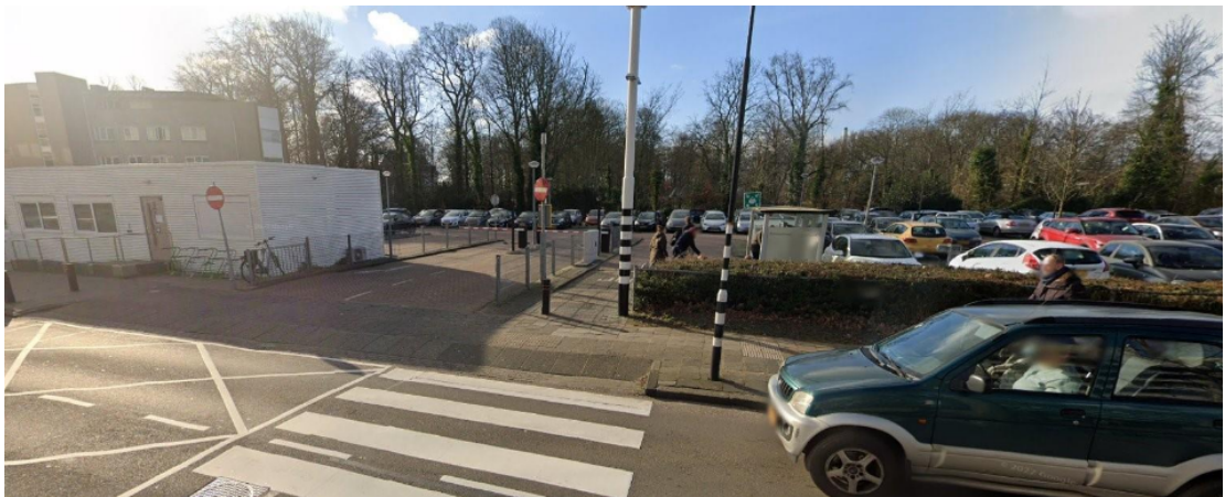
De huidige openbare ruimte voor het RKZ

De huidige uitstraling en ook de functionaliteit en veiligheid zijn echter niet optimaal. Met name de uitrit van het parkeerterrein, de smalle fietsstroken op de Vondellaan en de aftandse uitstraling maken het onaantrekkelijk om te verblijven. Er is geen directe verbinding met de achterliggende parkgebieden terwijl dit juist voor bezoekers, werknemers en patiënten een positief effect zou kunnen hebben.