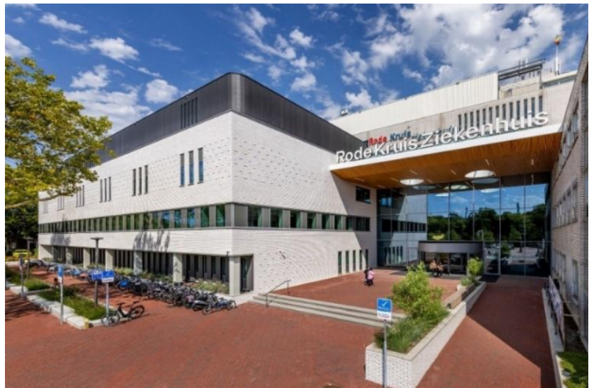
Het gerealiseerde deelgebied entree en Kiss en Ride strook RKZ